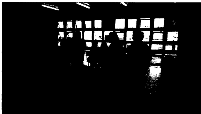
Praça da Ciência