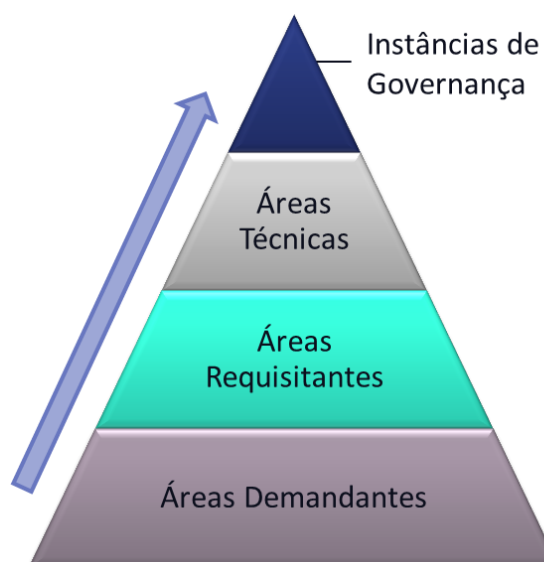
Figura 1 – Estrutura de Governança e Elaboração do PCA do TCE-RJ

O PCA de 2025 constitui o produto de um processo de elaboração que abrangeu a participação de áreas administrativas e de instâncias de governança do TCE-RJ, definidas na Resolução nº 429/23, como se apresenta a seguir.